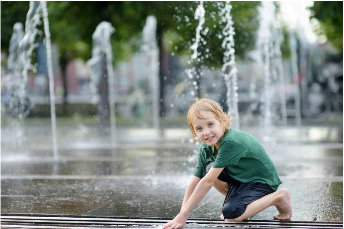
Un jeune garçon jouant avec des fontaines d'eau dans un parc.